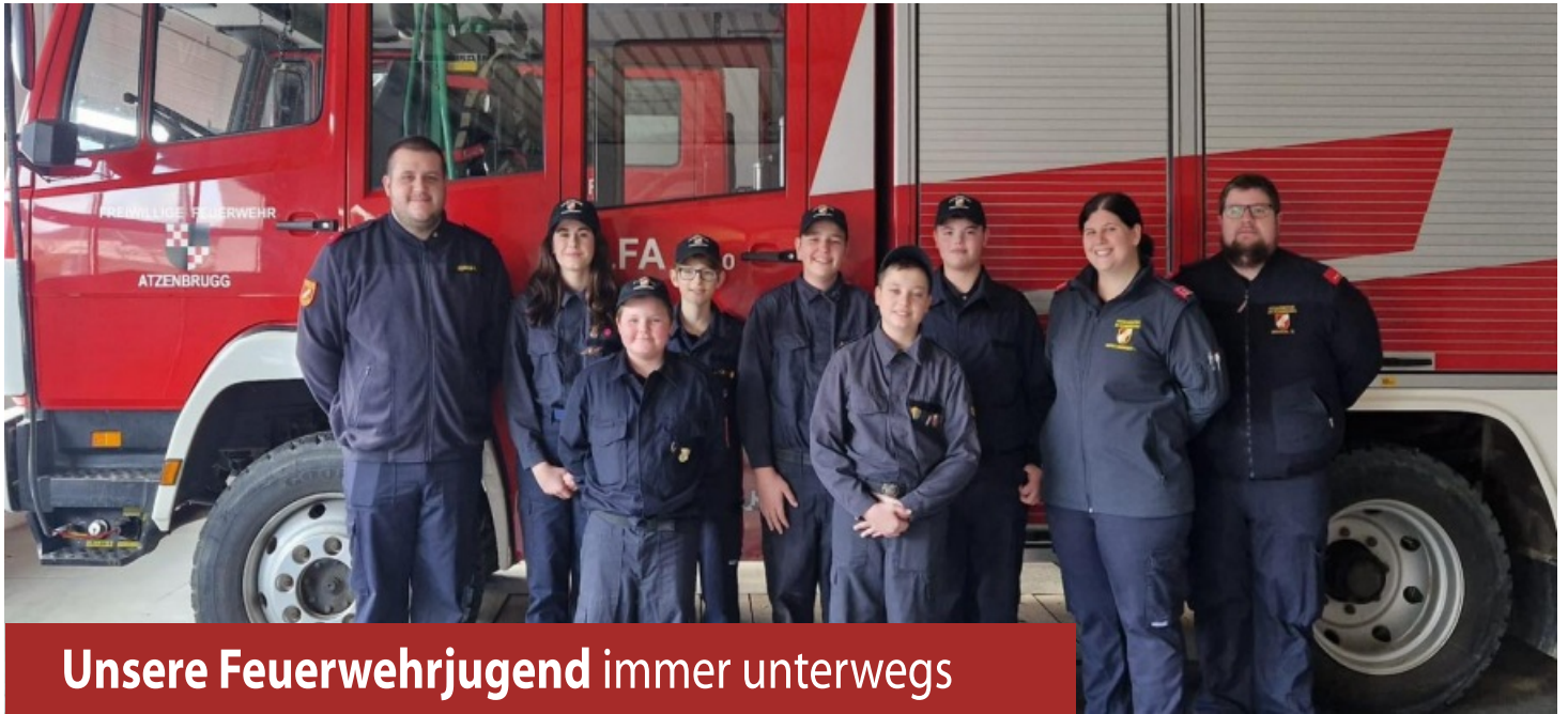
Unsere Feuerwehrjugend immer unterwegs