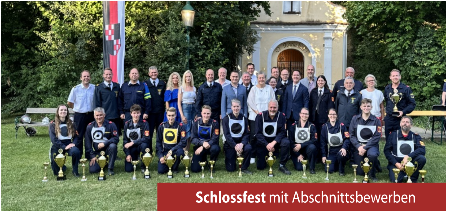
Schlossfest mit Abschnittsbewerben